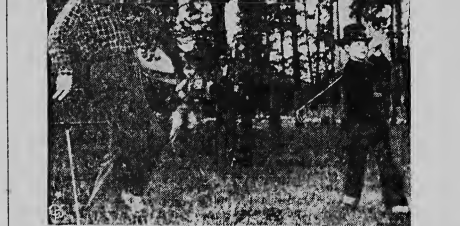
Ariba: President Eisenhower ta yuda su nieta cu e riendanan pa e subi un cabai di 11 anja color gris. Abao: e hefe ejecutivo ta fluit pasobra el a cabi di haci un shot caminda el a hera su obheto...